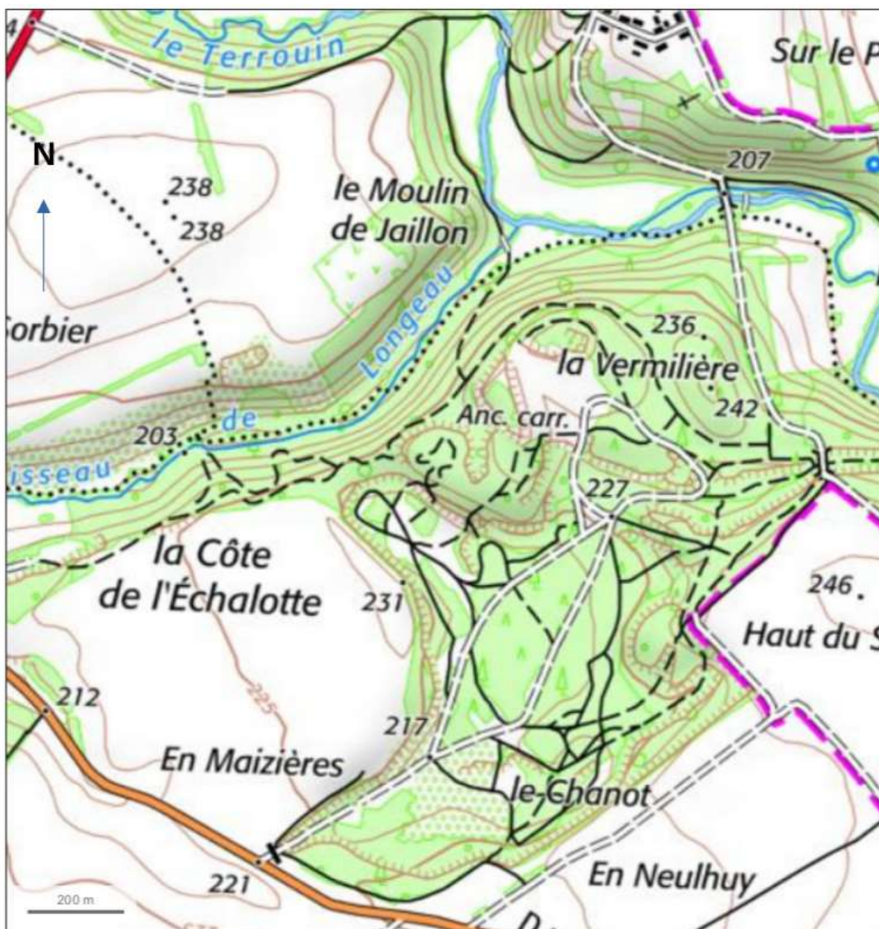
Fig 1 Carrière de Villey Geoportail