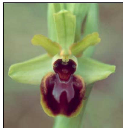
Ophrys sphegodes Mill. Ophrys araignée

On sait que la nature était sa principale source d'inspiration, et remarquables étaient sa connaissance et son amour des plantes, en particulier des orchidées. Très grand botaniste, il connaissait parfaitement les espèces lorraines auxquelles il avait consacré un important travail scientifique dont malheureusement seule une modeste partie avait été publiée avant son décès.