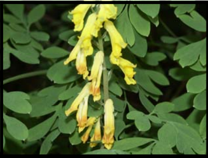
La corydale jaune Pseudofumaria lutea (L.) Borkh. François VERNIER