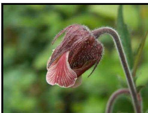
La benoîte des ruisseaux ( Geum rivale L.) - Lucette SOULLIEZ

Nota: les sorties du dimanche se font sur la journée. Ne pas oublier le repas à tirer du sac.