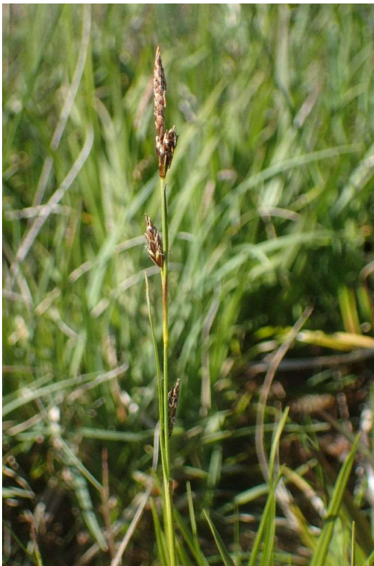
Carex de Host ( Carex hostiana )

Le site du Cheval Fin sur la commune de Les Forges - 88 (près d'Epinal) recèle quelques éléments très intéressants : le Carex de Davall ( Carex davalliana ) et Tomentypnum nitens , la Linaigrette à larges feuilles ( Eriophorum latifolium ) (une vingtaine de pieds, espèce protégée en Lorraine), le Carex de Host ( Carex hostiana ), 2 petites stations éloignées de 500m, le tout dans des prairies à Dactylorhize fistuleux à feuilles larges ( Dactylorhiza majalis ), le Scorsonère des prés ( Scorzonera humilis ) et la Succise des prés ( Succisa pratensis ). Mais tout ce site est à surveiller et (éventuellement) proposer un statut de protection ! Les taxons les + rares sont concentrés sur quelques mètres carrés (parcelle 42/41) et en nombre de pieds restreints (site sensible !).