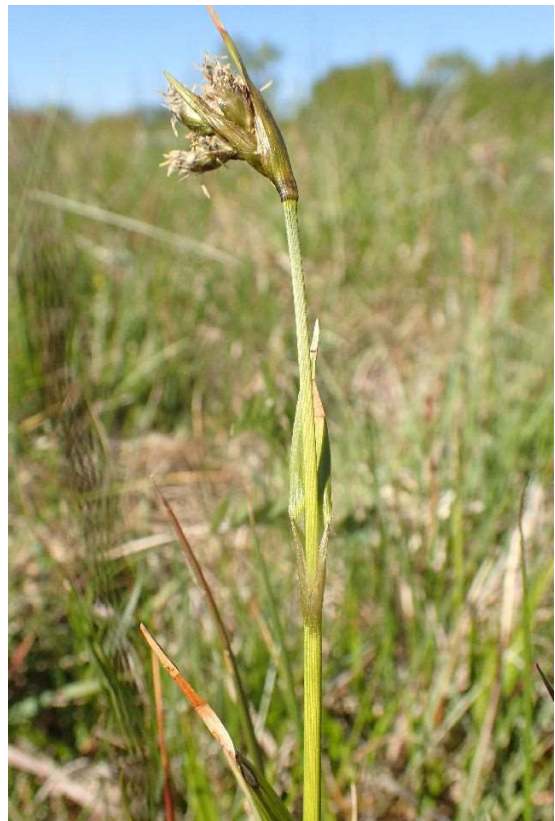
Linaigrette à larges feuilles ( Eriophorum latifolium )