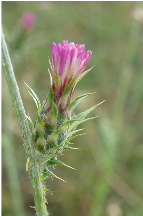
Chardon à capitules denses ( Carduus pycnocephalus subsp. pycnocephalus ) © Pierre MONTPIED

Pierre Montpied nous signale le Chardon à capitules denses ( Carduus pycnocephalus subsp. pycnocephalus L.) nouvelle espèce pour la Lorraine, découvert sur la commune d'Arracourt (54), maille Z20 dans un pacage à mouton, sur un site impacté par la guerre de 14-18.