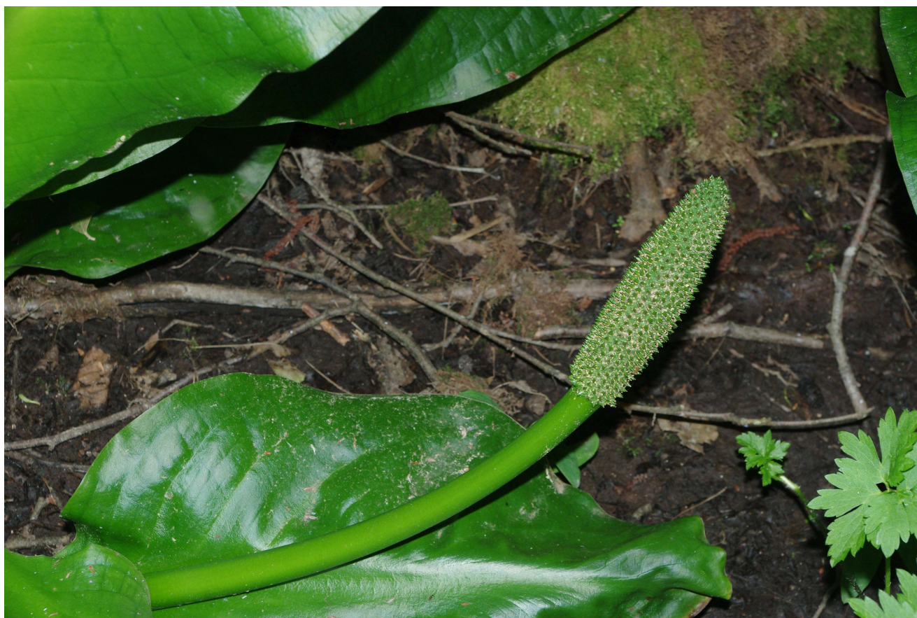
Inflorescence de Lysichiton americanus

A Méréville (54) , sous une haie de thuyas, observation d'un pied de Julienne des dames ( Hesperis matronalis ).