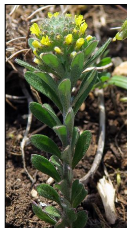
Photos de Mentha pulegium, Oxybasis rubra, Alyssum alyssoides