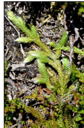
Photos de Pseudorchis albida , Allium victorialis et Lycopodium clavatum