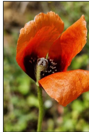
Photos de Myosurus minimus , Trifolium striatum et Papaver argemone