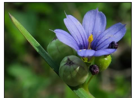
Photos de Geranium lucidum , Viola alba , Sisyrinchium montanum