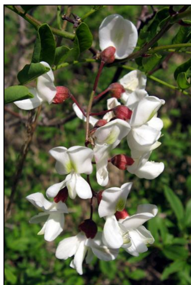
Photos de Robinia pseudoacacia, faussement appelé « Acacia »